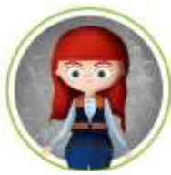
REPRESENTANTES DE ORGANISMOS, TALES COMO CRUZ ROJA, DEFENSA CIVIL, SCOUTS, ONG'S, ETC.