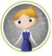
REPRESENTANTES DOCENTES, ESTUDIANTES, PADRES, MADRES, APODERADOS Y ASISTENTES DE LA EDUCACIÓN.