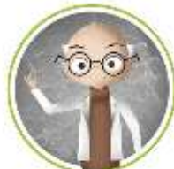
MONITOR/A O COORDINADOR/A