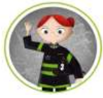
REPRESENTANTES DE LAS UNIDADES DE SALUD (EMERGENCIAS Y REHABILITACIÓN), BOMBEROS, CARABINEROS