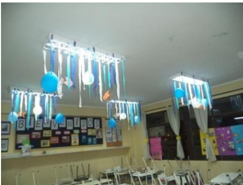
Anexo: Triangulo del Fuego.